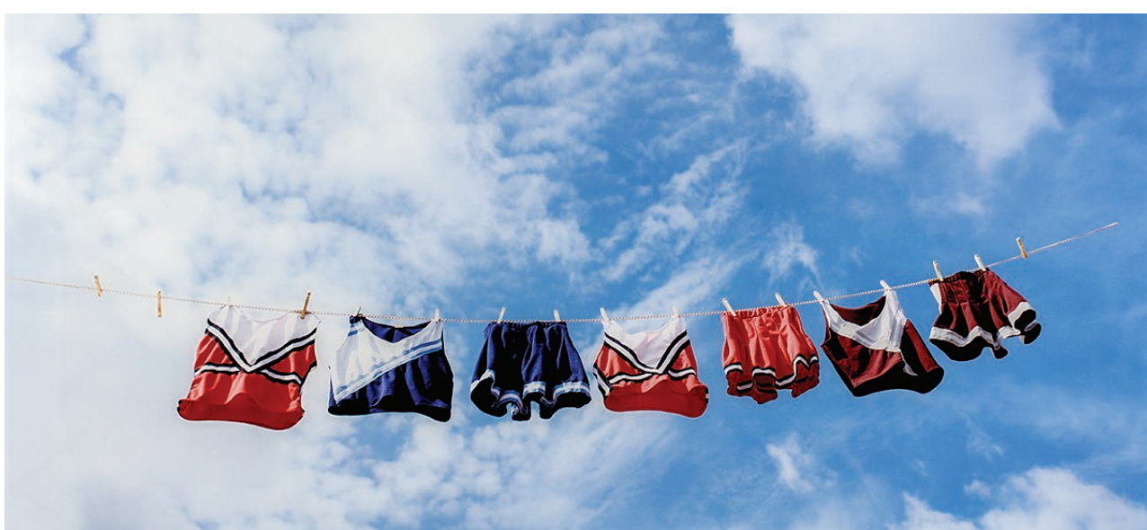
La obra de Luis Gisbert incluye fotografía, video, sonido y escultura, mientras la temática gira en torno a la cultura urbana hip-hop, juvenil y cubano americana.

Años después, luego de ser embajador de Cuba ante Estados Unidos, Cintas decidió establecer una fundación de arte y tras su fallecimiento en Nueva York, 1957, sus deseos fueron cumplidos cinco años después •